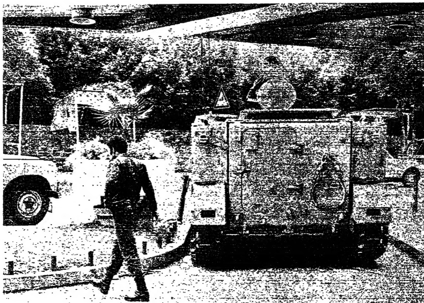
احدى ملاقات القسوة الضاربة في الصنّاع امس

الهدوء النسبي التي شهدتها والضواحي تيل ظهر امس، لم تيزخرت مع اندلاع الازمة صباحاً الظهر وازدياد الاشتباكات الدائفة. ولم توتر معلومات من القنص واللجرجي حتى المساء تاريز قواي التي اوردت المعلومات